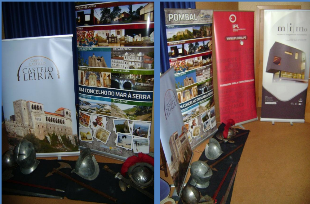
Exposição de materiais de divulgação – Rede Urbana e projetos convidados (na foto material Viv'Arte)