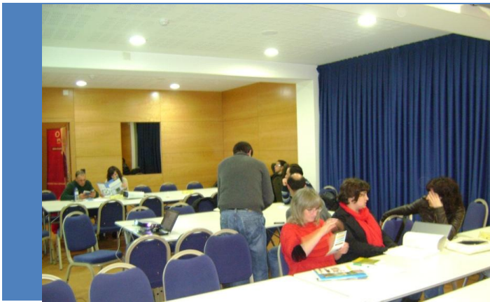
Chegada dos primeiros participantes